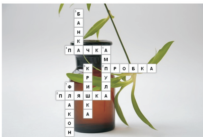
Рис. 5. Приклад кросворду до теми «Тара, закупорювальні засоби, пакувальні матеріали»