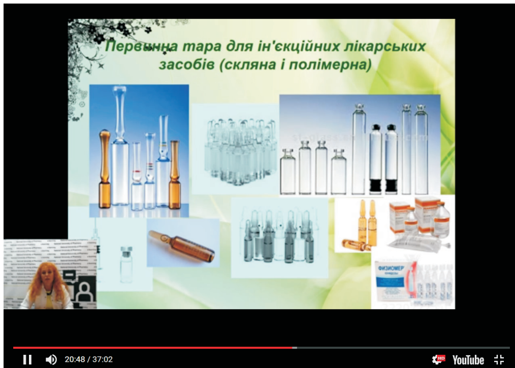
Рис. 6. Приклад відео для виконання практичних завдань за темою «Тара, закупорювальні засоби, пакувальні матеріали»

До кожної теми курсу зроблено відео для виконання практичних завдань, яке містить: загальні відомості, основні терміни та поняття з теми та ретельні пояснення про послідовність виконання практичних завдань (рис. 6).