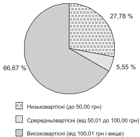
Рис. 3. Розподіл лікувальних бальзамів для губ, що реалізуються в аптеках України, за ціновими групами

Важливим чинником, який обумовлює ефективно просування товарів аптечного асортименту, зокрема і косметичних засобів, на фармацевтичний ринок є роздрібна ціна товару. Тому наступним етапом наших досліджень стало проведення аналізу цінових характеристик бальзамів із вищенаведеною лікувальною властивістю. За результатами підрахунків середньозваженої роздрібною ціни на лікувальні бальзами для губ, що досліджуються, за допомогою методу рівних інтервалів ( h = 50,00 грн) нами були сформовані умовні групи, а саме «низьковартісні», «середньовартісні» та «високовартісні» косметичні засоби. Так, до першої групи «низьковартісних» засобів увійшли асортиментні позиції із значенням середньозваженої роздрібною ціни до 50,00 грн, до «середньовартісних» – від 50,01 до 100,00 грн, а до «високовартісних» – від 100,01 грн і вище. Розподіл лікувальних бальзамів для губ за ціновими групами наведено на рис. 3. Як бачимо з даних рис. 3, безперечна більшість асортиментних позицій лікувальних бальзамів є «високовартісними», що за умов низької платоспроможності більшості населення України робить їх недоступною для пересічних споживачів.